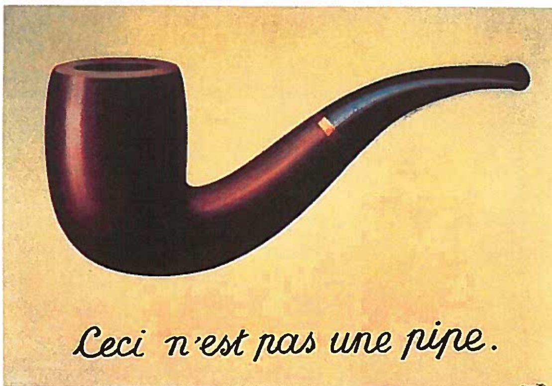
René Magritte, La traïció de les imatges.

Duchamp, el cubisme, el surrealisme i altres exponents dels orígens de l'art del segle XX plantegen qüestions extremes al qué i cóm del coneixement que es convertiran en models de bona part de l'art actual.