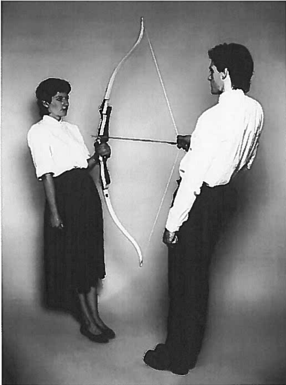
Marina Abramovic y Ulay, Energía en repòs.

En aquest punt del curs, extraurem tot el suc filosòfic que destil·la la bona part de l'art contemporani.