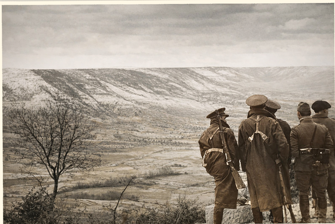
Tratamiento de las imágenes: "indiohill"