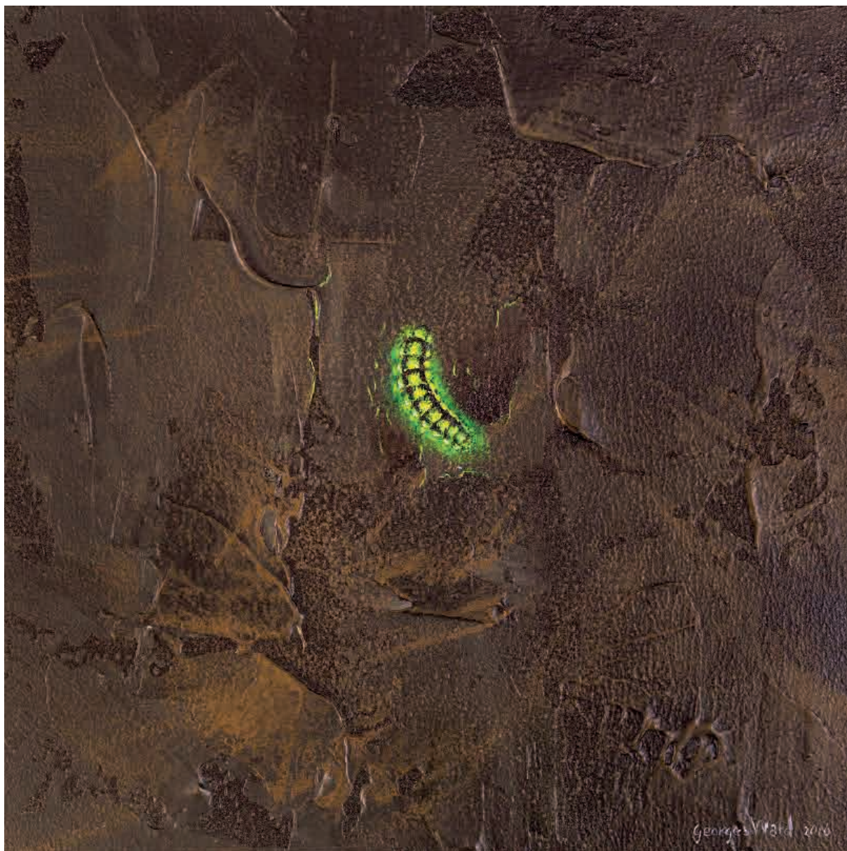
Firefly VIII , 2016. Acrílico sobre tabla, 20 x 20 cm