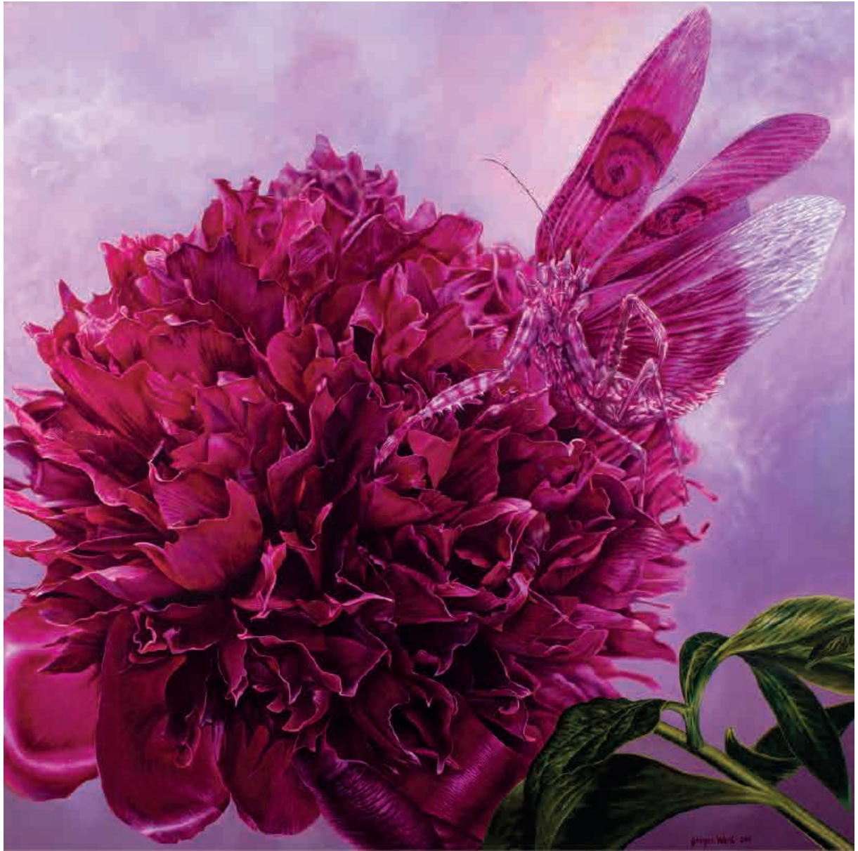
La morada de la reina , 2011. Acrílico sobre tabla, 160 x 160 cm