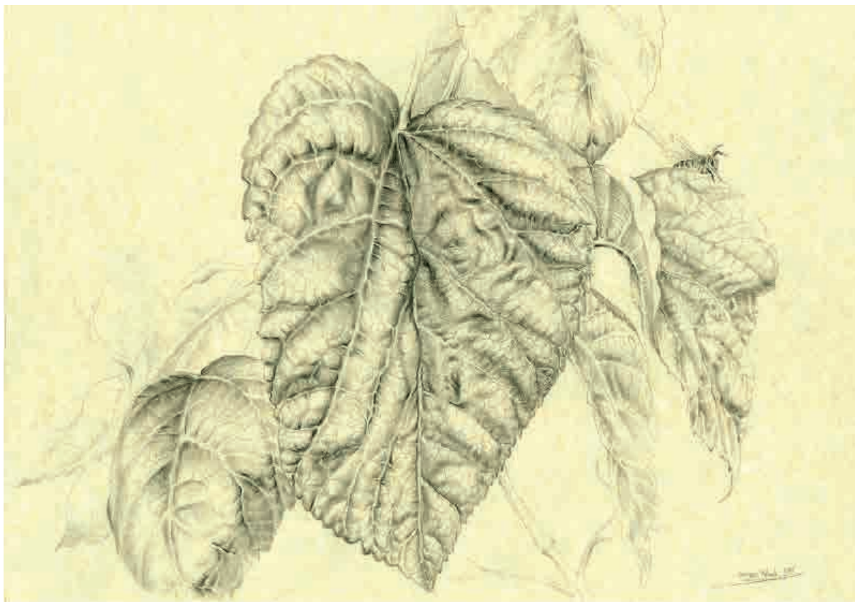
Memorias de Ibiza III , 2015. Grafito sobre papel, 21 x 29,5 cm