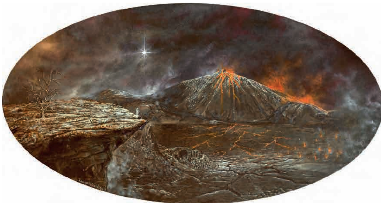
Dante inferno IV , 2021. Acrílico sobre tabla, 20 x 38 cm