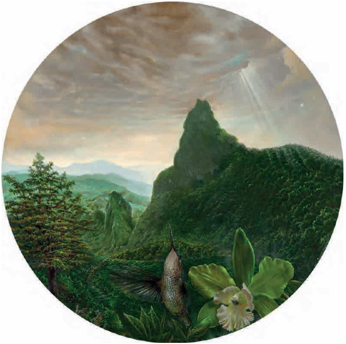
Fura/Tena , 2017. Acrílico sobre tabla, 36 cm Ø