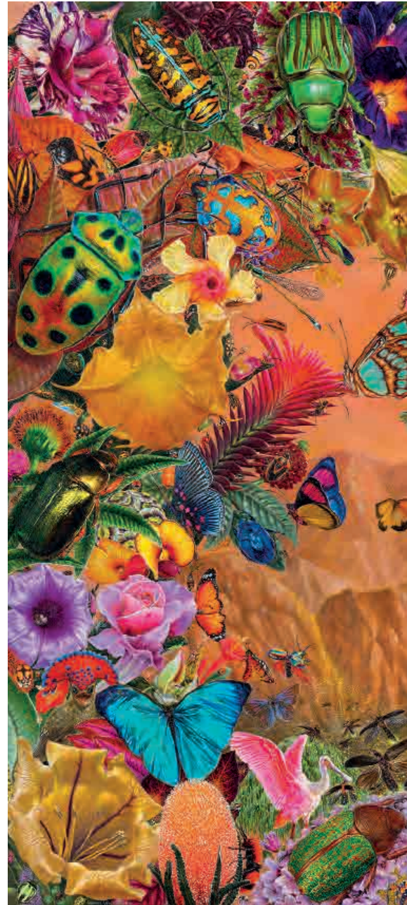
Earth , 2022. Acrílico sobre tabla, 85 x 140 cm