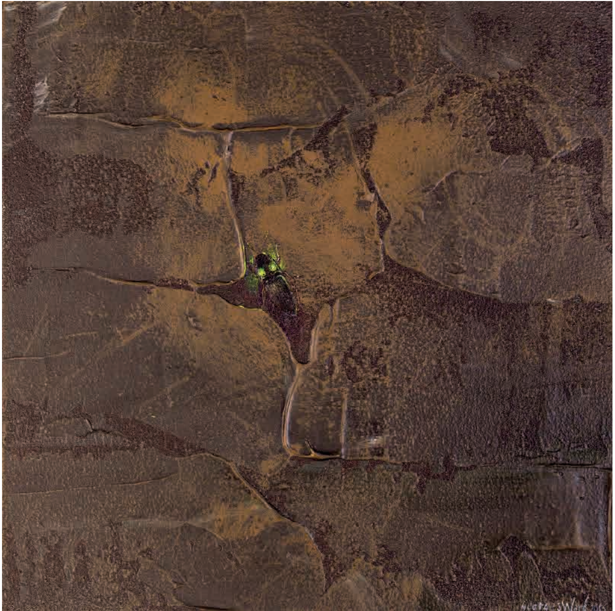
Firefly IX , 2016. Acrílico sobre tabla, 20 x 20 cm