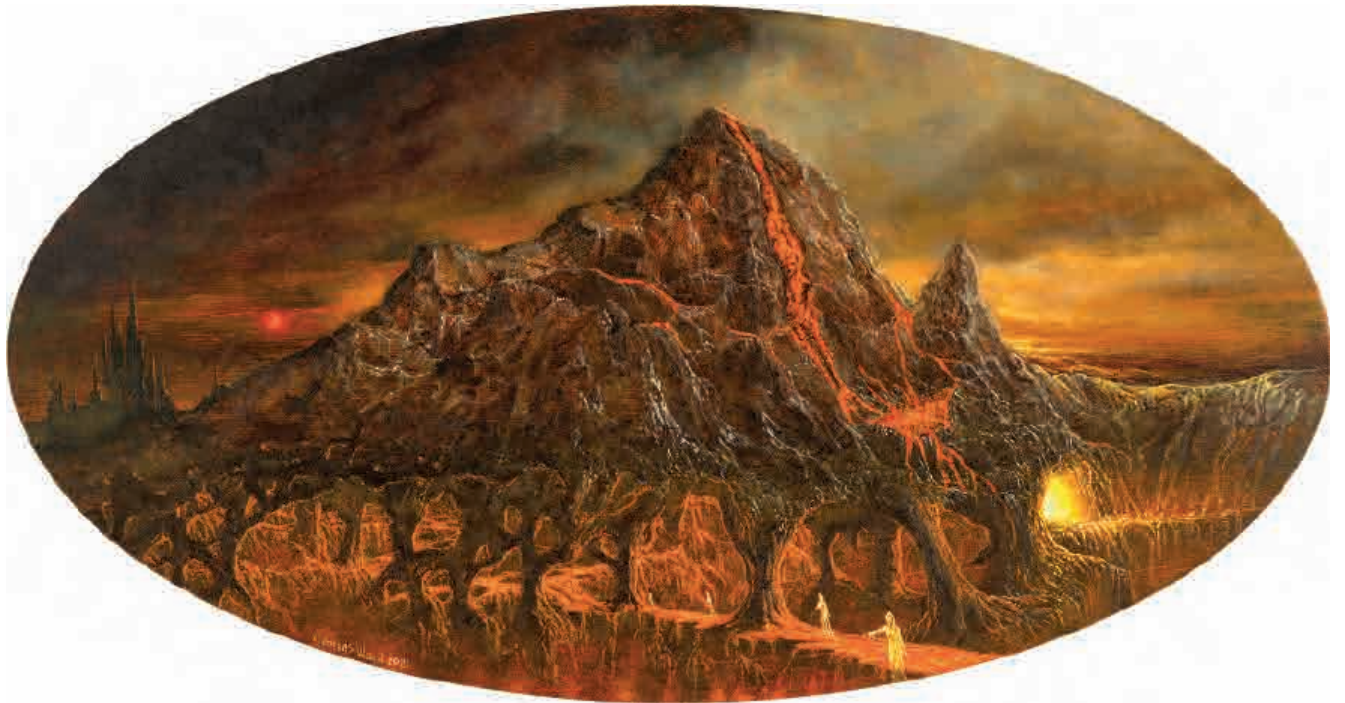
Dante inferno I , 2021. Acrílico sobre tabla, 20 x 38 cm