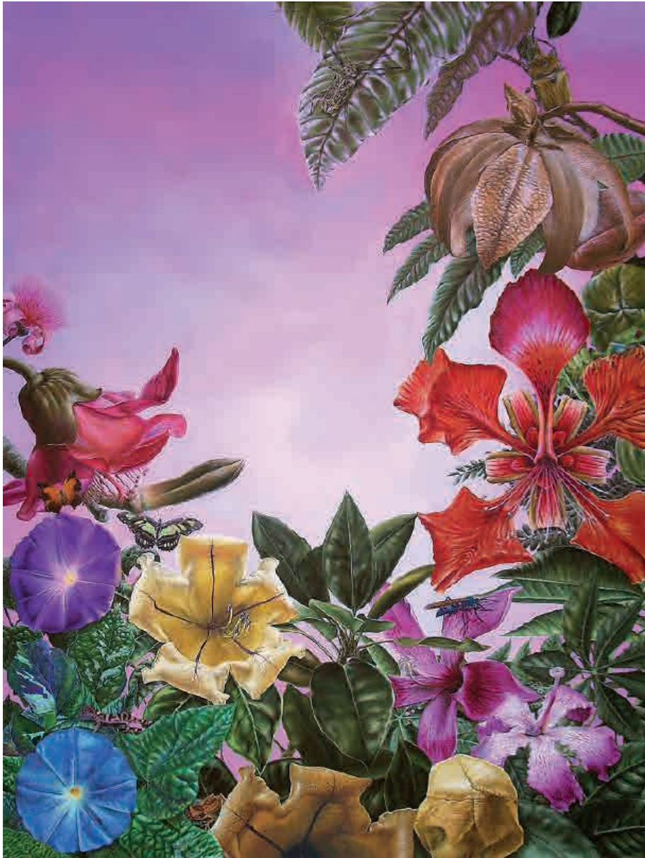
Esplendor en la selva mexicana , 2009. Acrílico sobre tabla, 130 x 97 cm