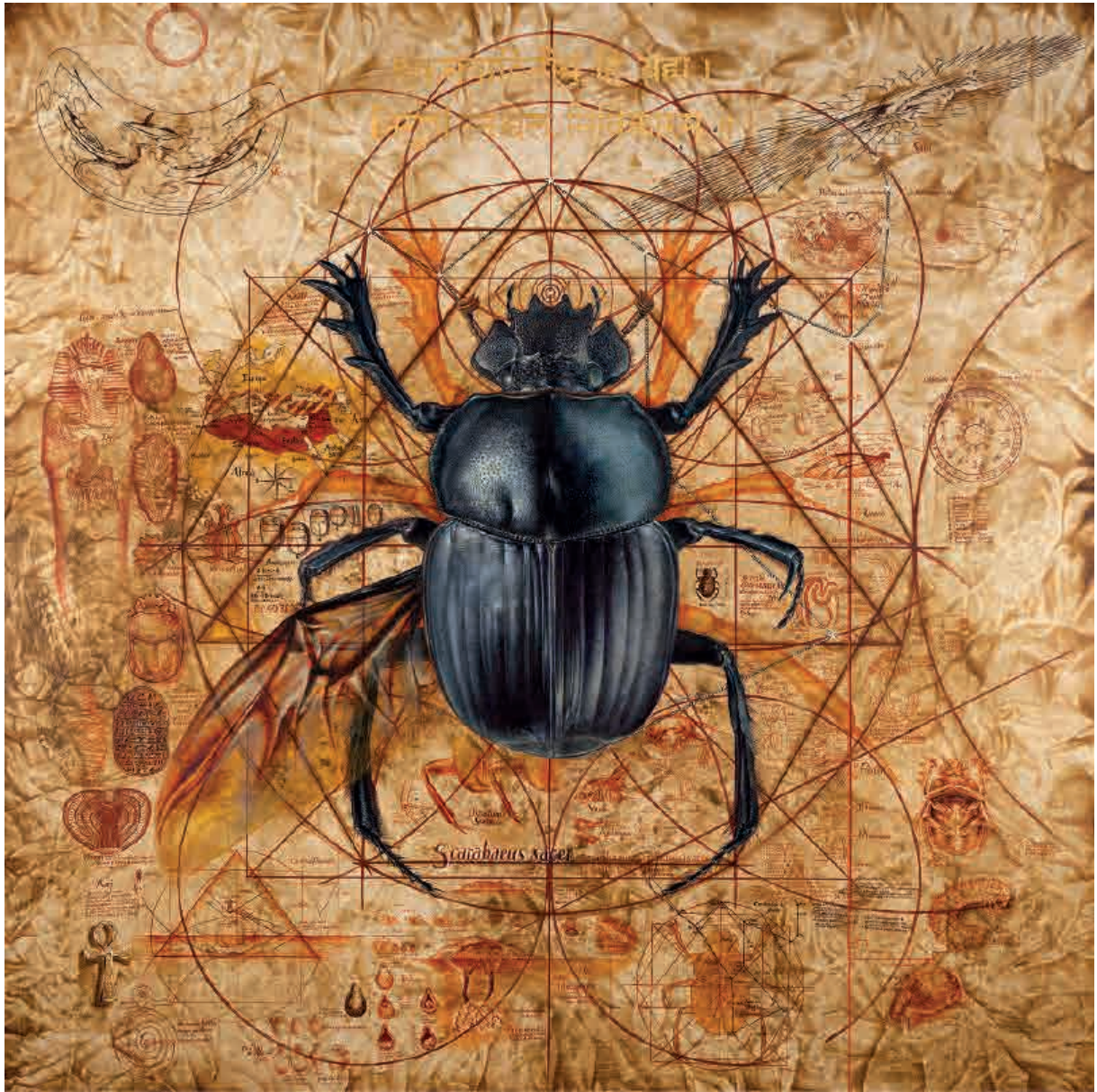
Aenigma , 2017. Acrílico sobre tabla, 150 x 150 cm