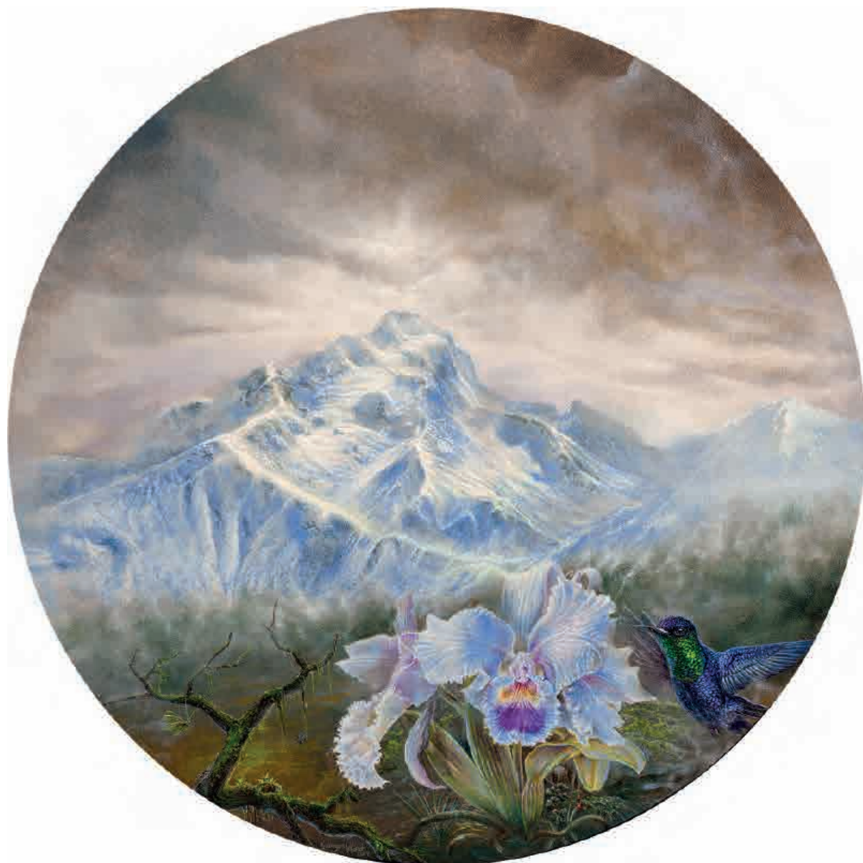
Muzelle, 2017. Acrílico sobre tabla, 36 cm Ø