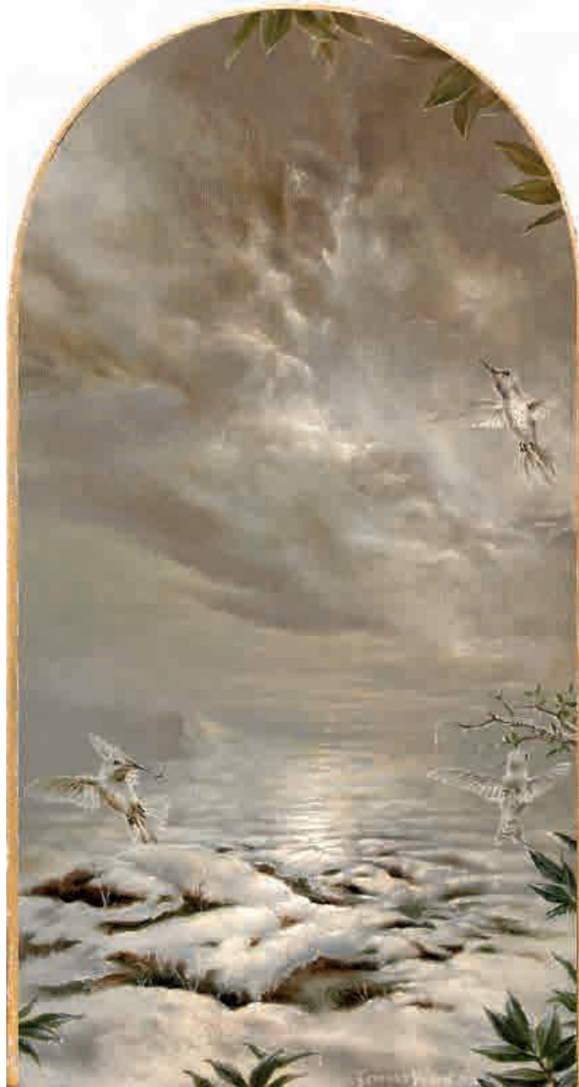
Divine garden, Crypt III (cara A) 2018. Acrílico sobre tabla, 24,9 x 13,4 cm