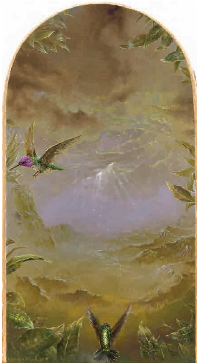
Divine garden, Crypt II (cara A) 2018. Acrílico sobre tabla, 24,9 x 13,4 cm