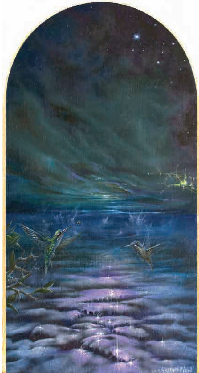
Divine garden, Crypt III (cara B) 2018. Acrílico sobre tabla, 24,9 x 13,4 cm