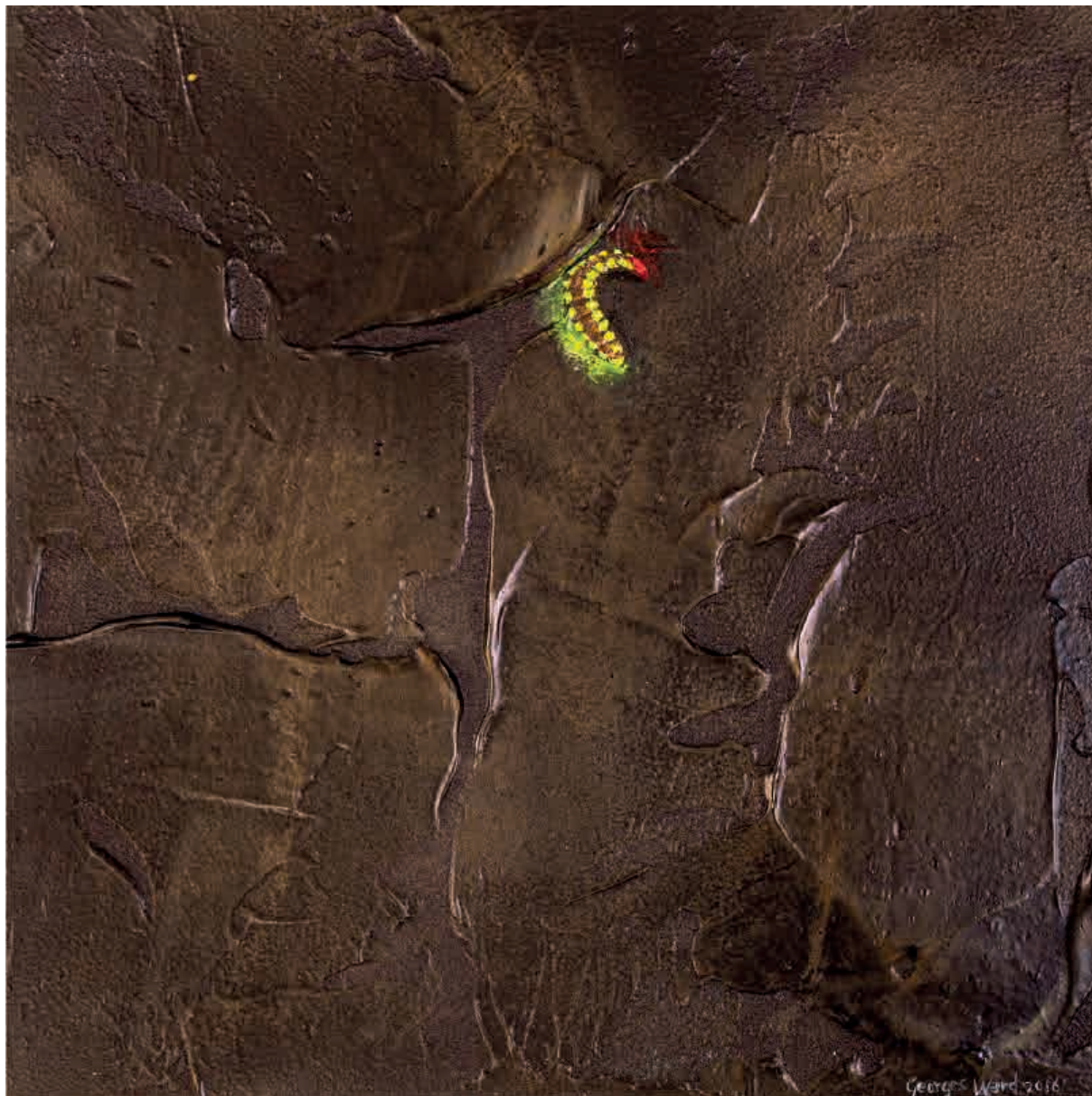
Firefly VII , 2016. Acrílico sobre tabla, 20 x 20 cm