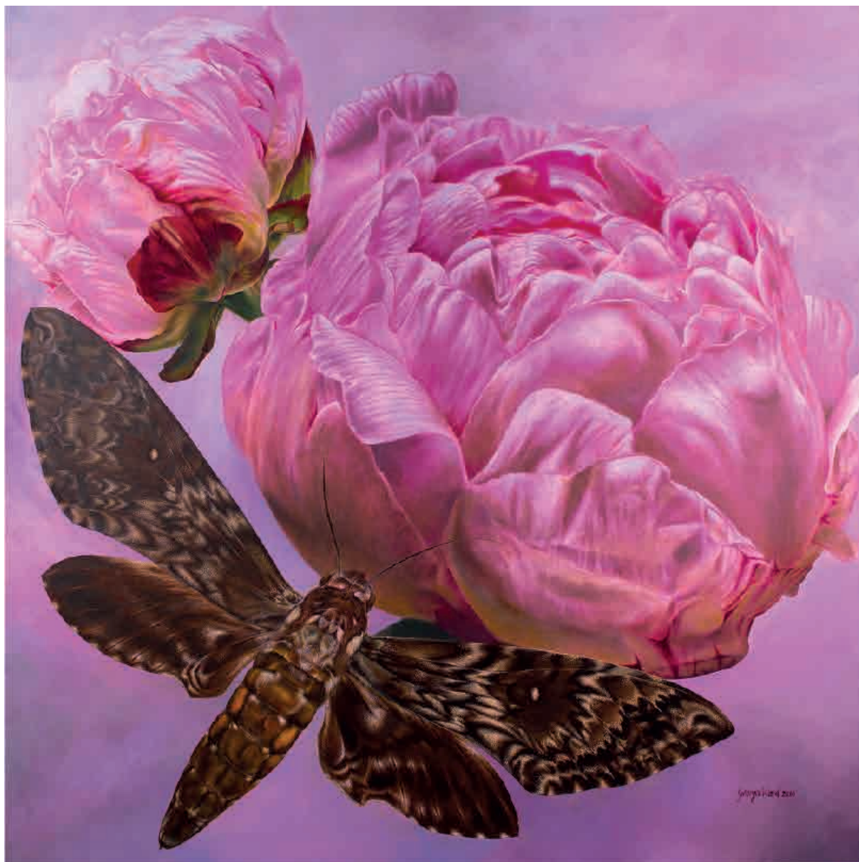
En busca del perfume , 2010. Acrílico sobre tabla, 160 x 160 cm