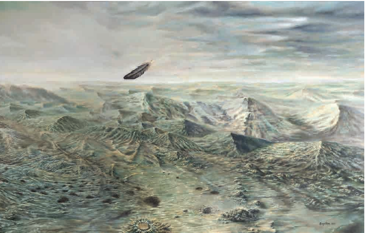
El pasajero de lo eterno , 2013. Acrílico sobre lienzo, 87 x 277 cm