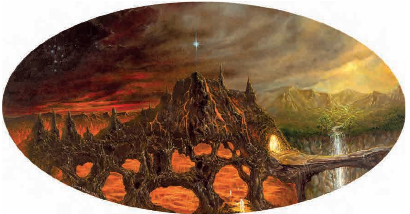
Dante inferno II , 2021. Acrílico sobre tabla, 20 x 38 cm