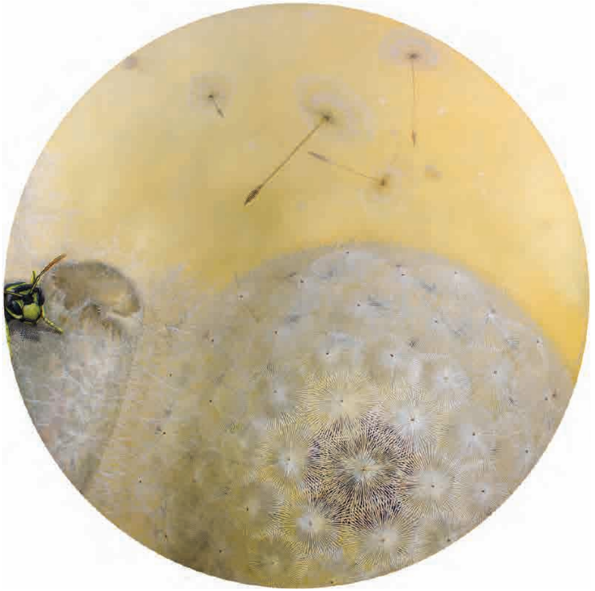
La unión de los viajes , 2012. Acrílico sobre tabla, 150 cm Ø