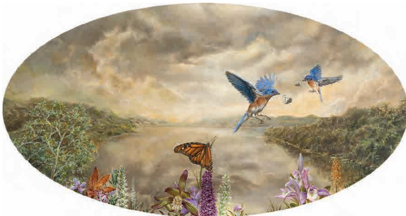
Lumberville , 2021. Acrílico sobre tabla, 20 x 38 cm