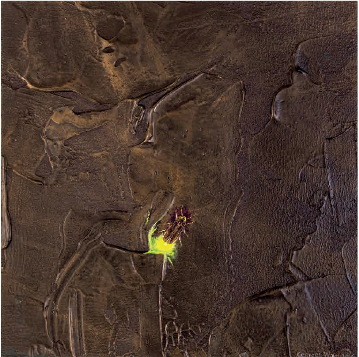
Firefly III , 2016. Acrílico sobre tabla, 20 x 20 cm