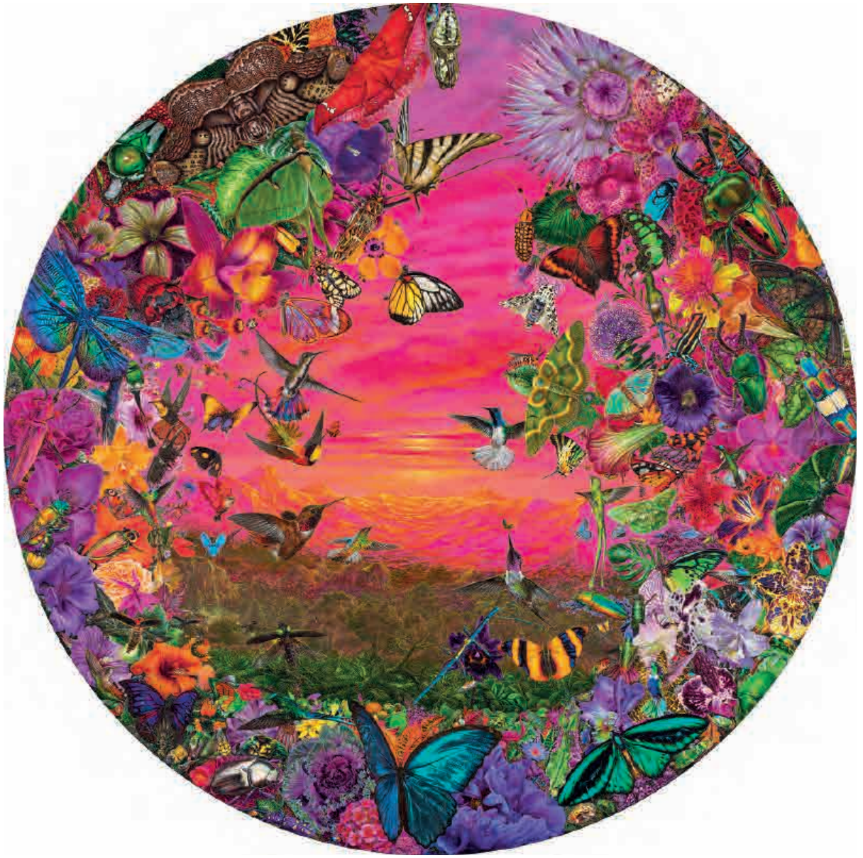
Life , 2020. Acrílico sobre tabla, 121 cm Ø