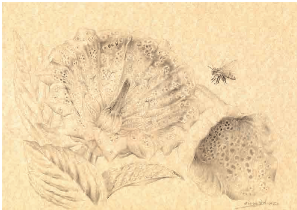
Memorias de Ibiza X , 2015. Grafito sobre papel, 21 x 29,5 cm