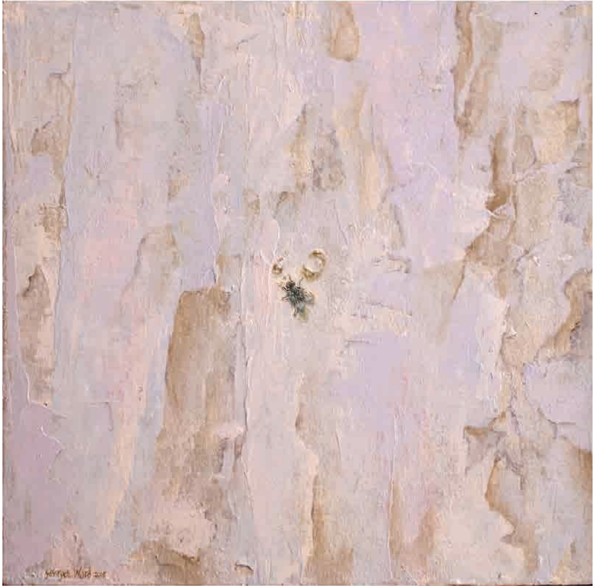
Fly I , 2016. Acrílico sobre tabla, 20 x 20 cm