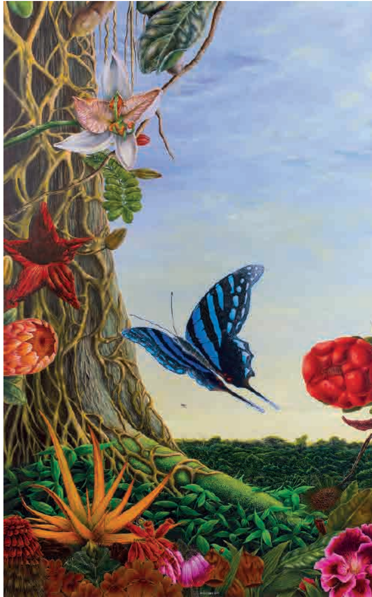
Jungla africana , 2009. Acrílico sobre tabla, 131 x 82 cm