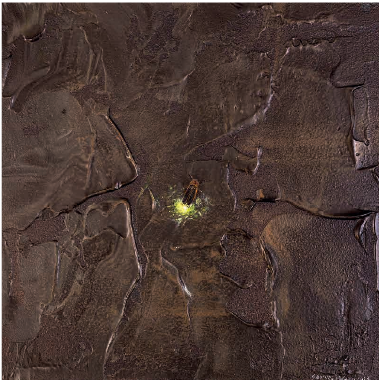
Firefly I , 2016. Acrílico sobre tabla, 20 x 20 cm