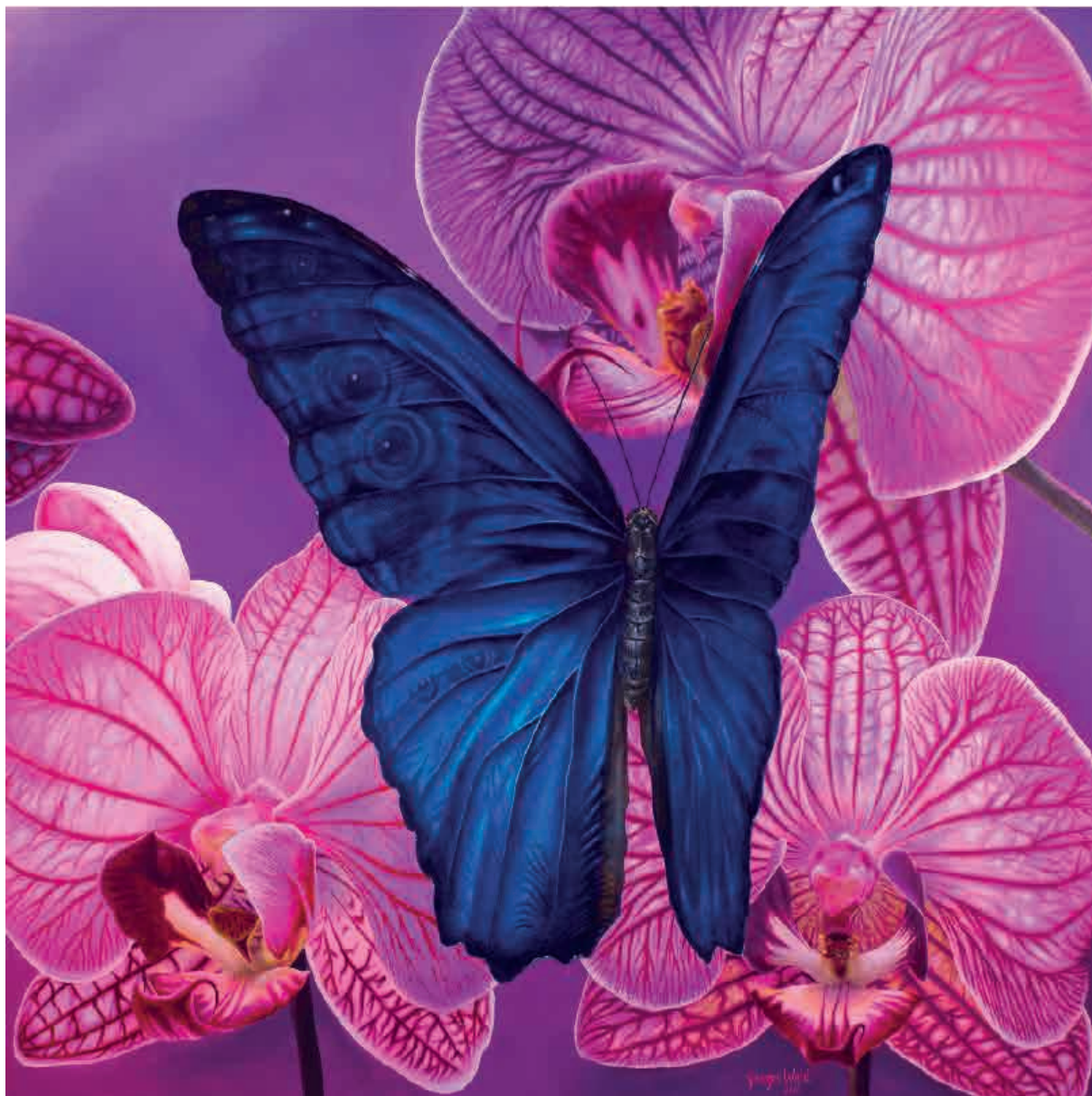
El encuentro de Morpheo , 2010. Acrílico sobre tabla, 160 x 160 cm