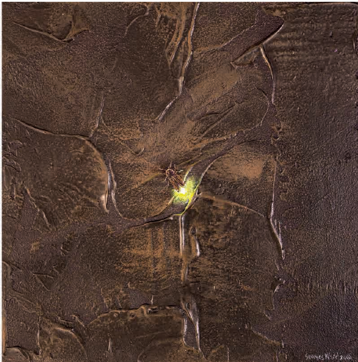
Firefly II , 2016. Acrílico sobre tabla, 20 x 20 cm