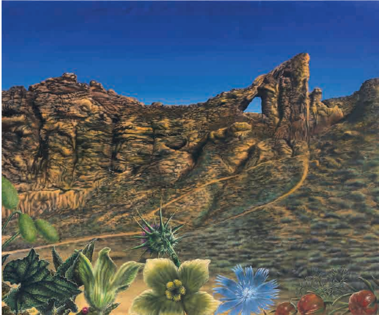
Juslibol, paraíso de sol , 2009. Acrílico sobre tabla, 46 x 61 cm