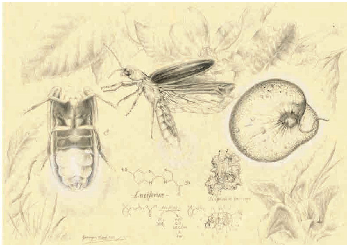
Compendium I, 2015. Grafito sobre papel, 21 x 29,5 cm