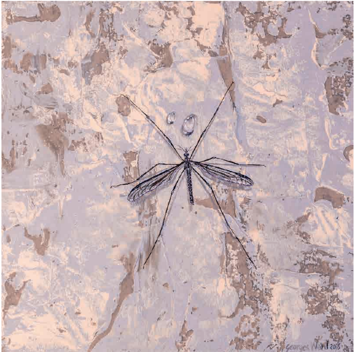
Crane fly , 2016. Acrílico sobre tabla, 20 x 20 cm