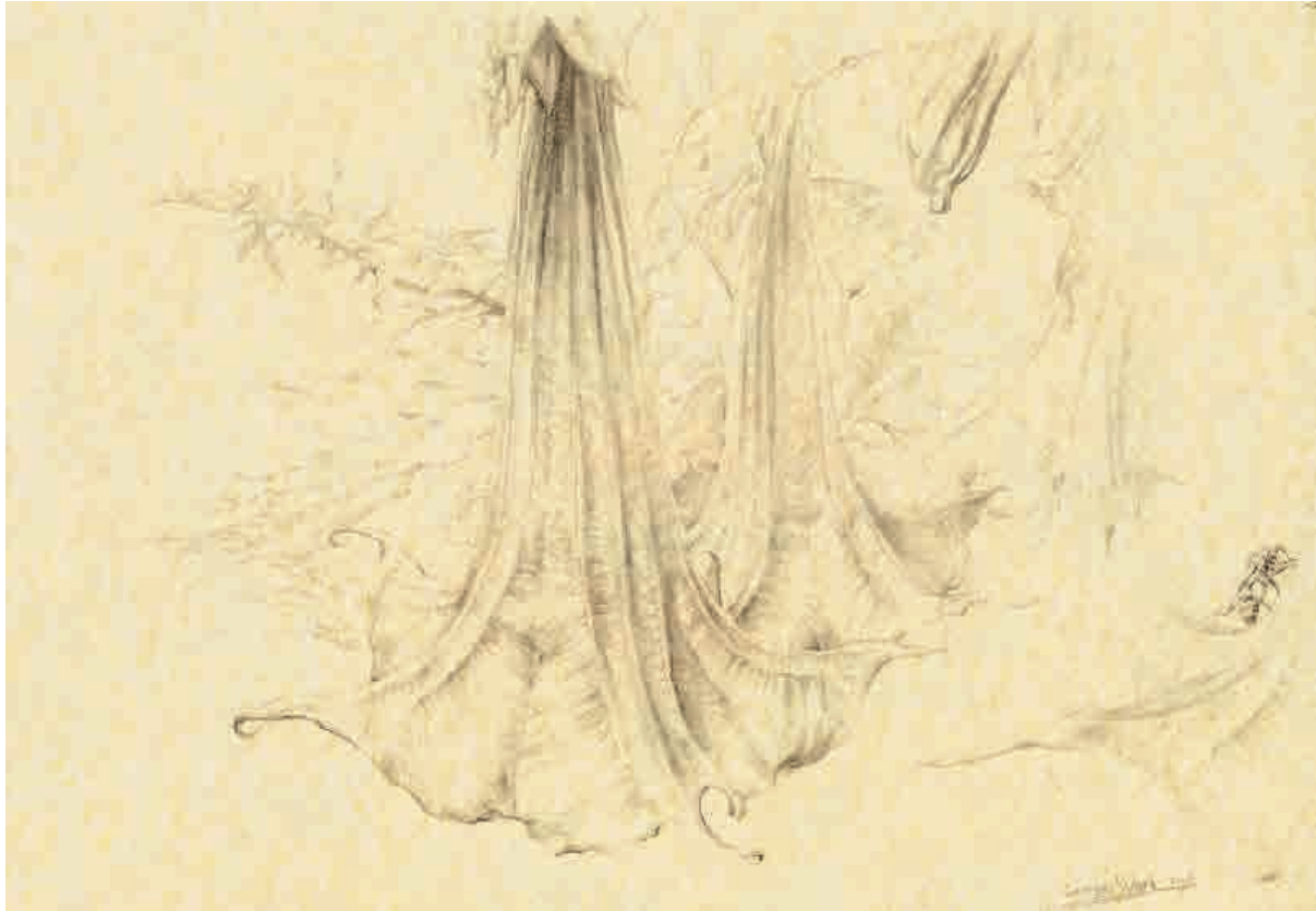
Memorias de Ibiza VII , 2015. Grafito sobre papel, 21 x 29,5 cm