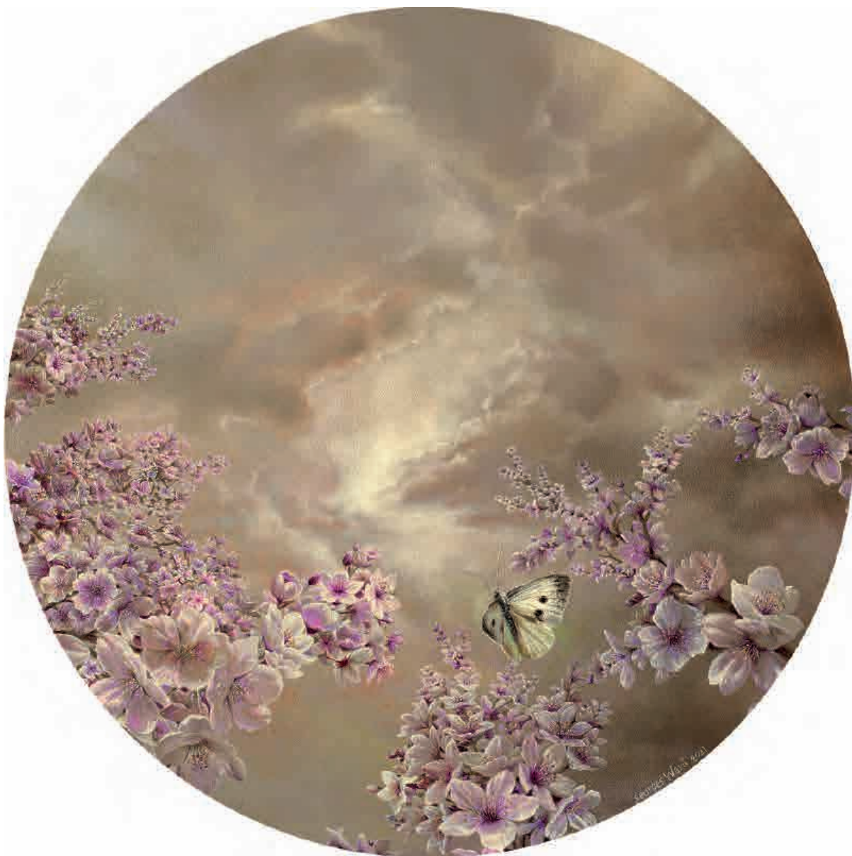
Sakura II , 2021. Acrílico sobre tabla, 36 cm Ø