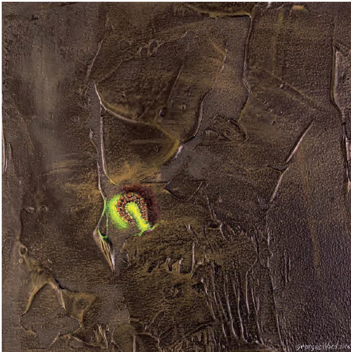
Firefly VI , 2016. Acrílico sobre tabla, 20 x 20 cm