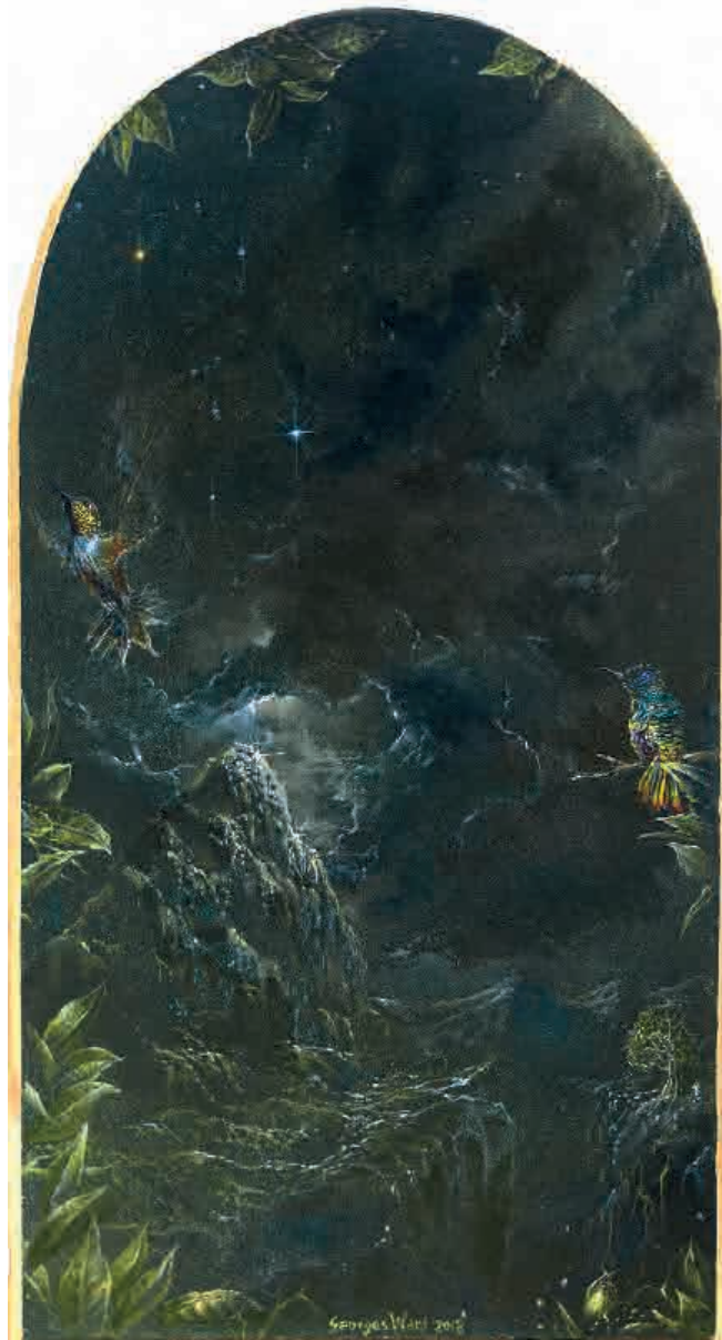
Divine garden, Crypt II (cara B) 2018. Acrílico sobre tabla, 24,9 x 13,4 cm