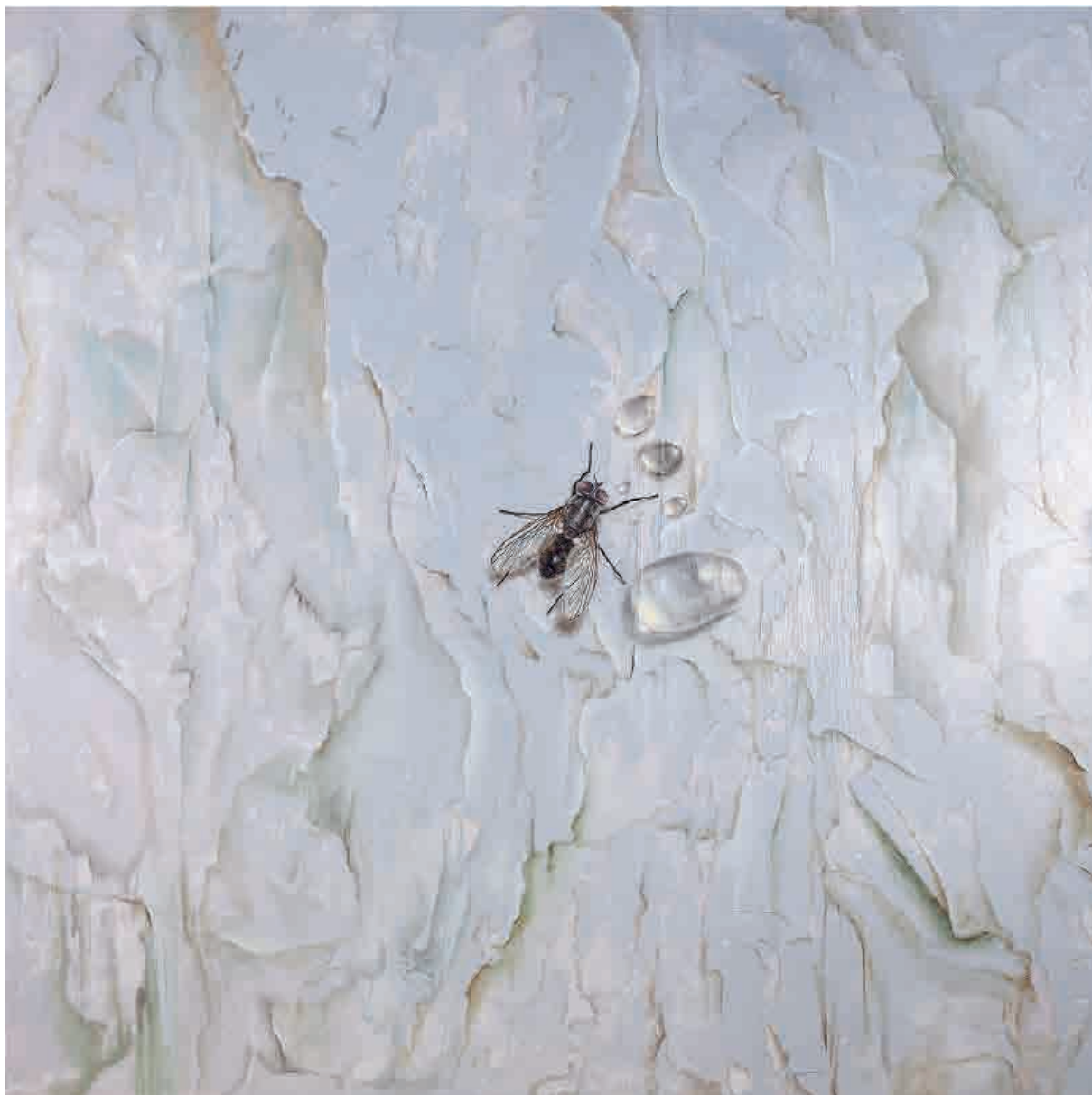
Fly on the wall , 2016. Acrílico sobre tabla, 150 x 150 cm