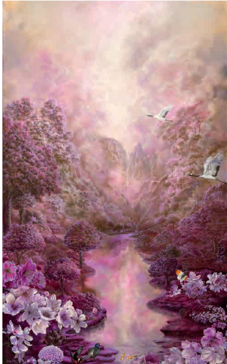
Japanese garden , 2020. Acrílico sobre tabla, 131 x 81,5 cm