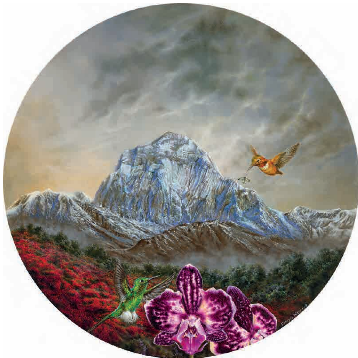
Annarpurna , 2019. Acrílico sobre tabla, 36 cm Ø