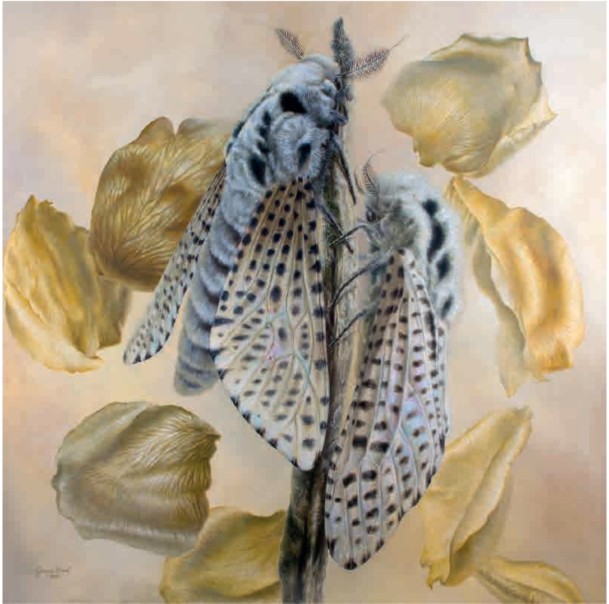
Hel-Hada , 2012. Acrílico sobre tabla, 160 x 160 cm