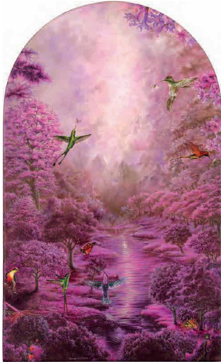
Pink garden , 2019. Acrílico sobre tabla, 55 x 33,5 cm