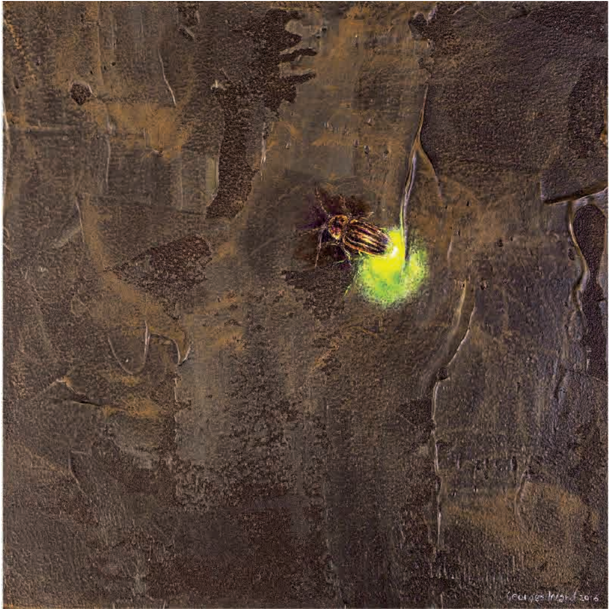
Firefly V , 2016. Acrílico sobre tabla, 20 x 20 cm