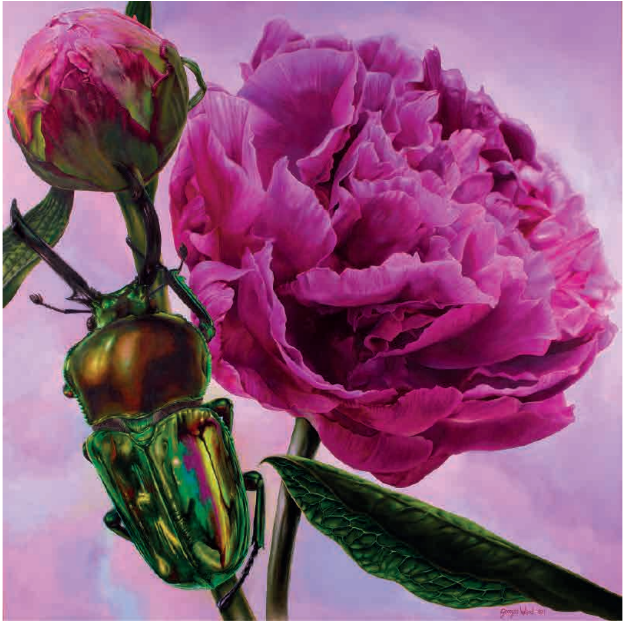
Caballero y princesa , 2011. Acrílico sobre tabla, 160 x 160 cm