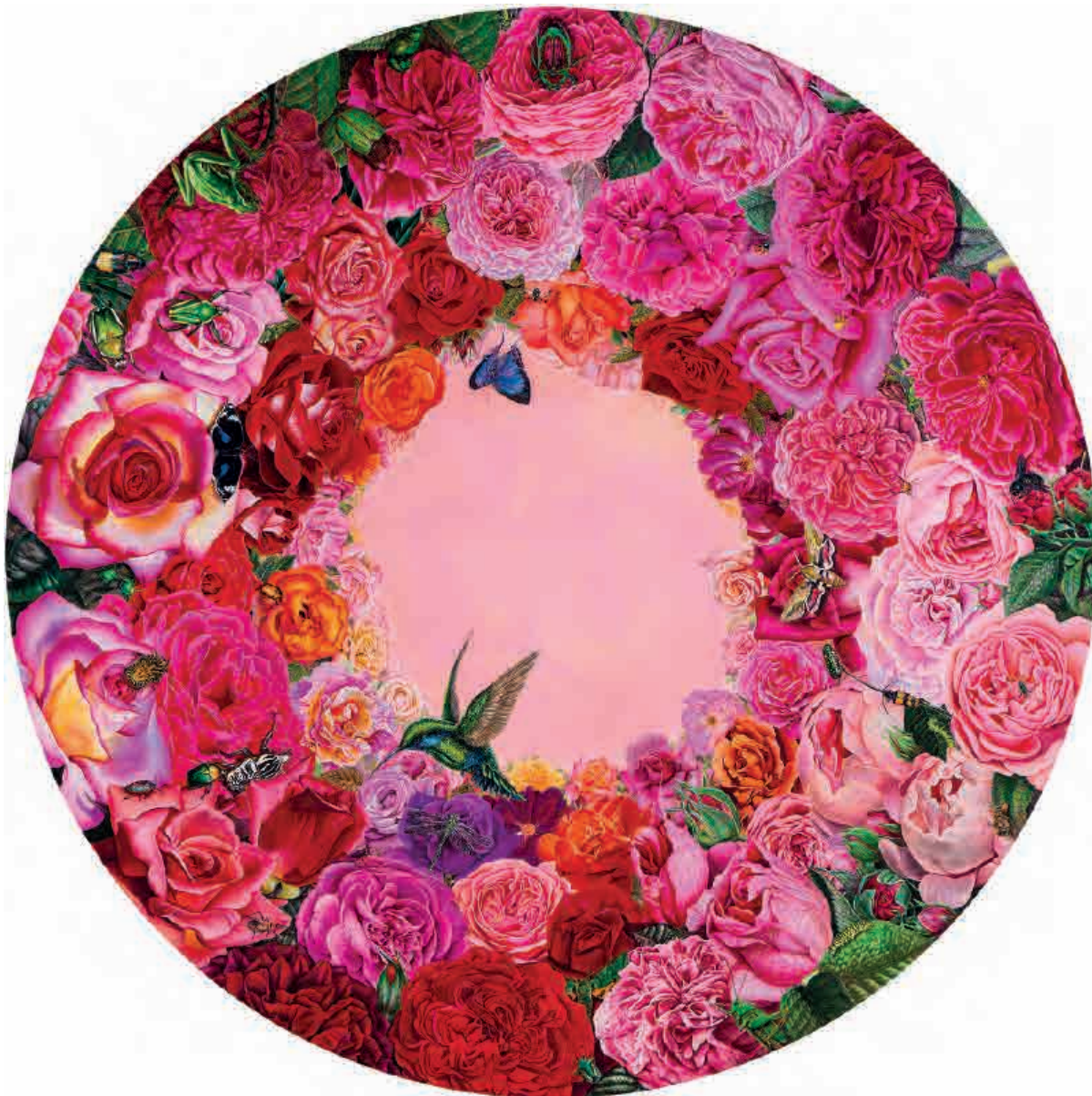
Rosas del mundo , 2008. Acrílico sobre tabla, 112 cm Ø