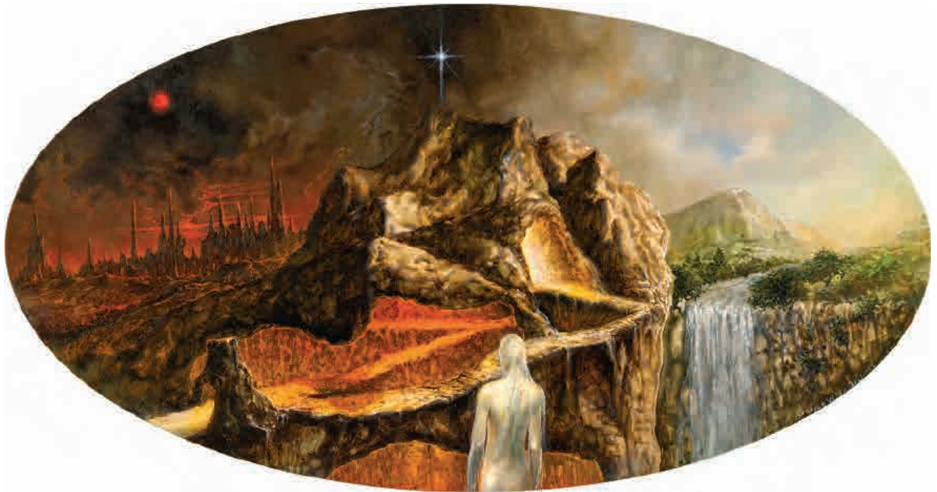
Dante inferno III , 2021. Acrílico sobre tabla, 20 x 38 cm