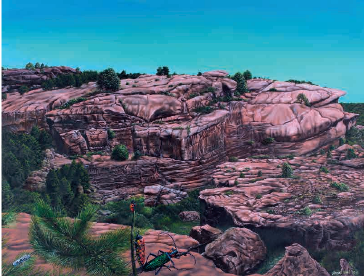
Contemplando el rodano , 2010. Acrílico sobre tabla, 46 x 61 cm