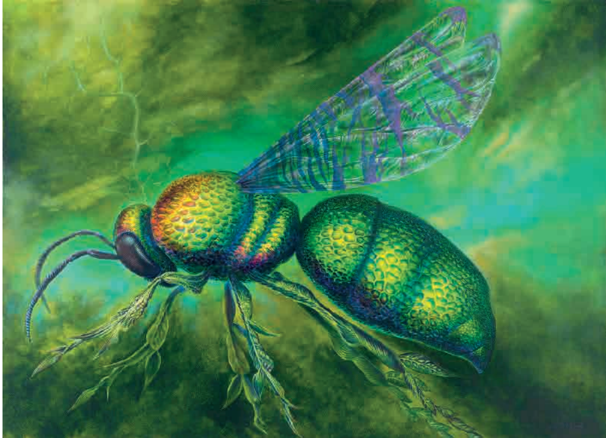
Conexion , 2014. Acrílico sobre tabla, 80 x 110 cm