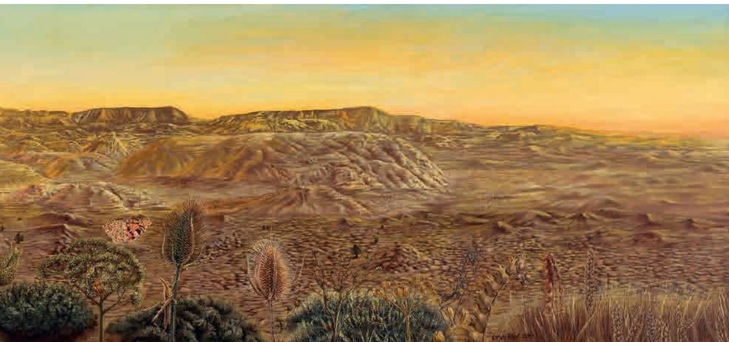
Paraíso de Monegrillo I , 2009. Acrílico sobre tabla, 42 x 180 cm