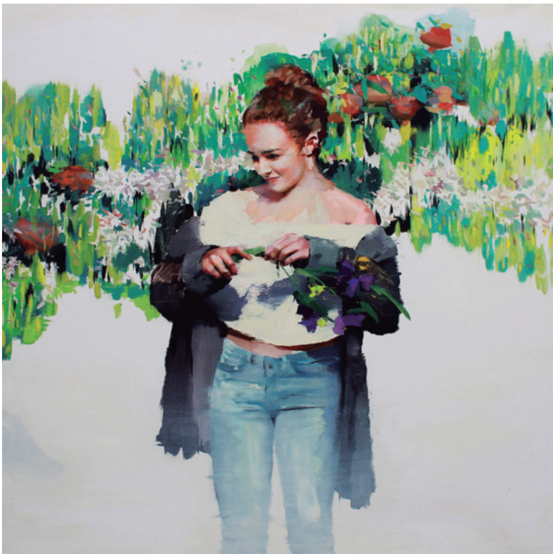
Gacela de amor inesperado. 2018/2019 Óleo sobre lienzo. 120 x 120 cm