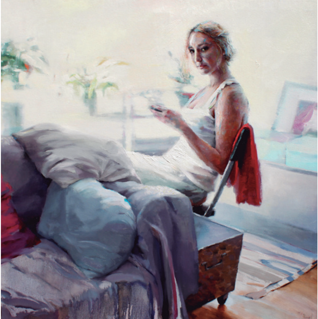
La reina madre. 2012 Óleo sobre lienzo. 130 x 130 cm