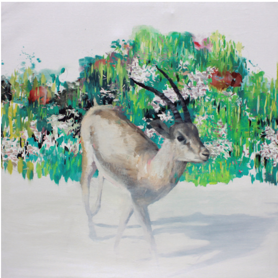
Gacela de amor inesperado. 2018/2019 Óleo sobre lienzo. 120 x 120 cm