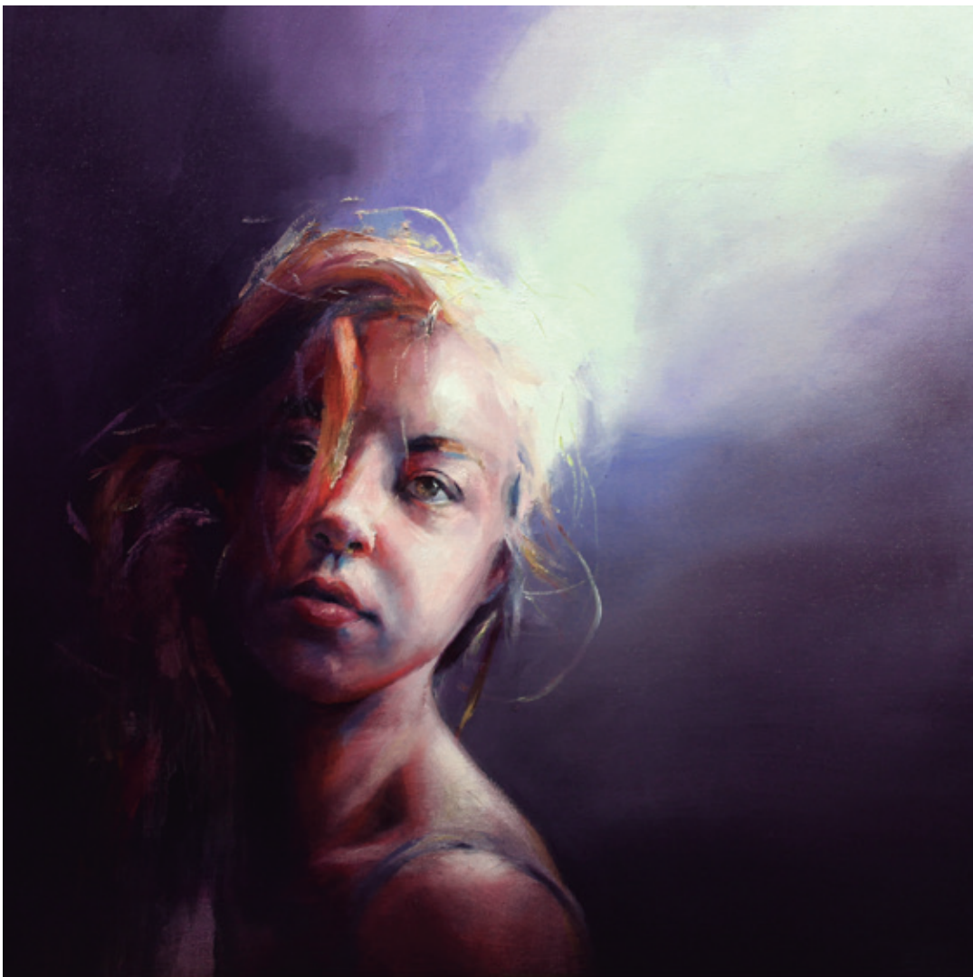
Ensoñada I. 2018/2019 Óleo sobre lienzo. 50 x 50 cm