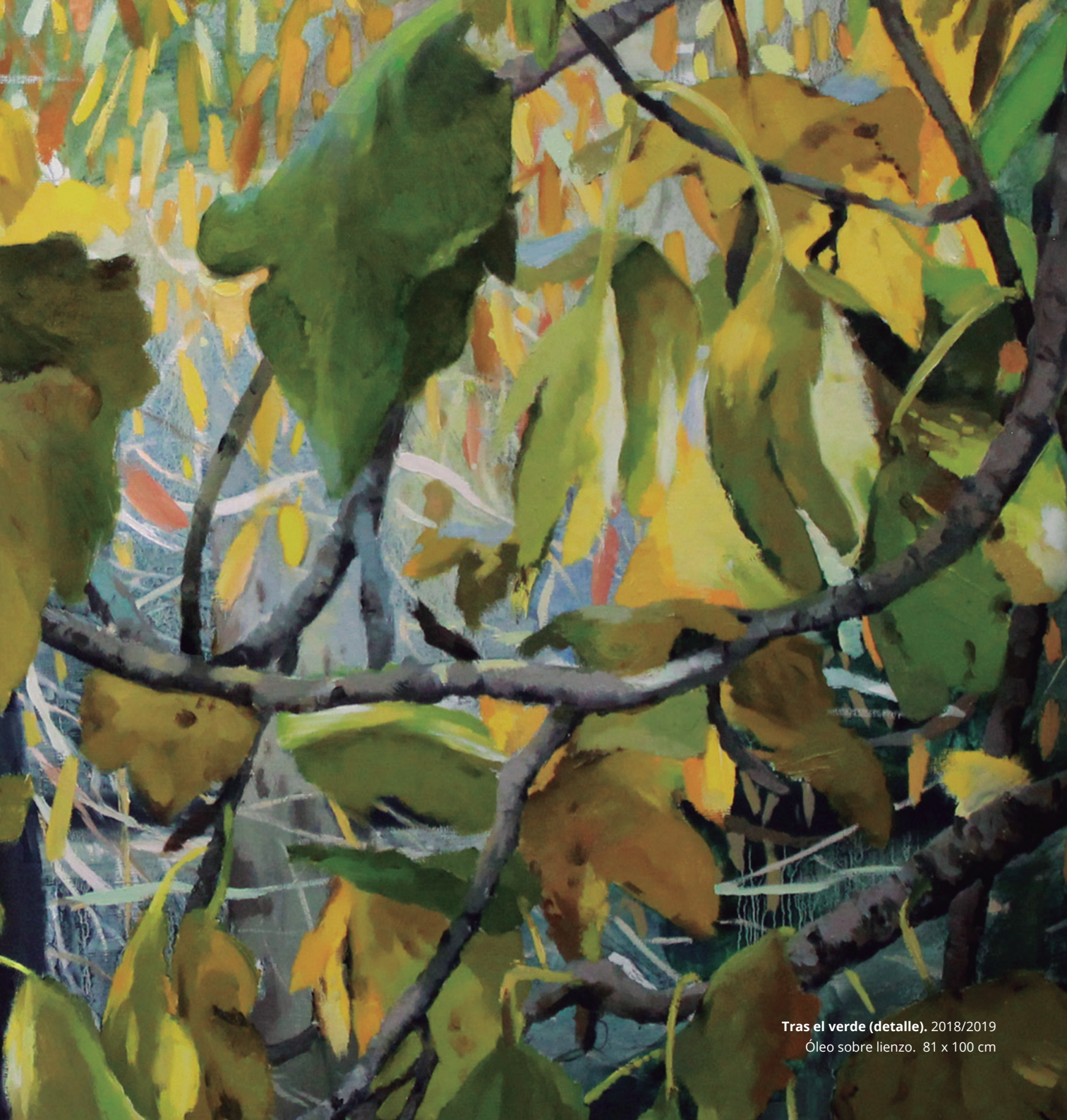
Tras el verde (detalle). 2018/2019 Óleo sobre lienzo. 81 x 100 cm