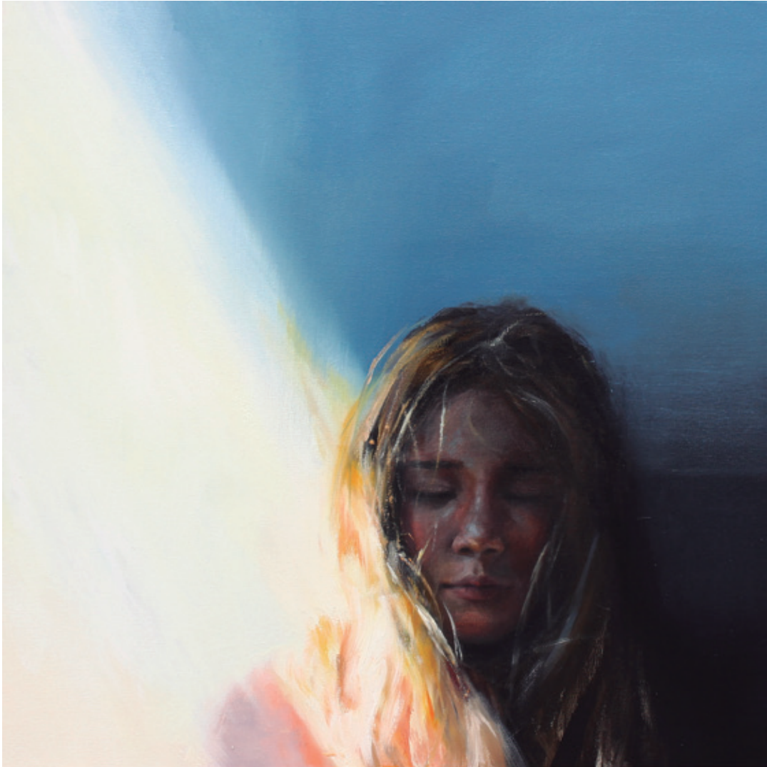
Ensoñada II. 2018/2019 Óleo sobre lienzo. 50 x 50 cm