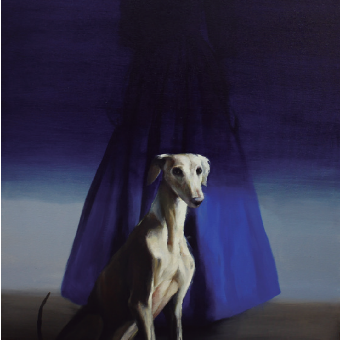
Casada infiel II. 2018/2019 Óleo sobre lienzo. 80 x 80 cm