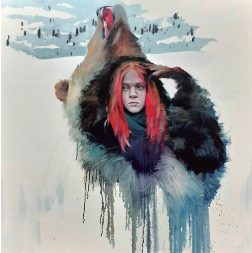
Quisiera ser fiero para ti. I. 2018/2019