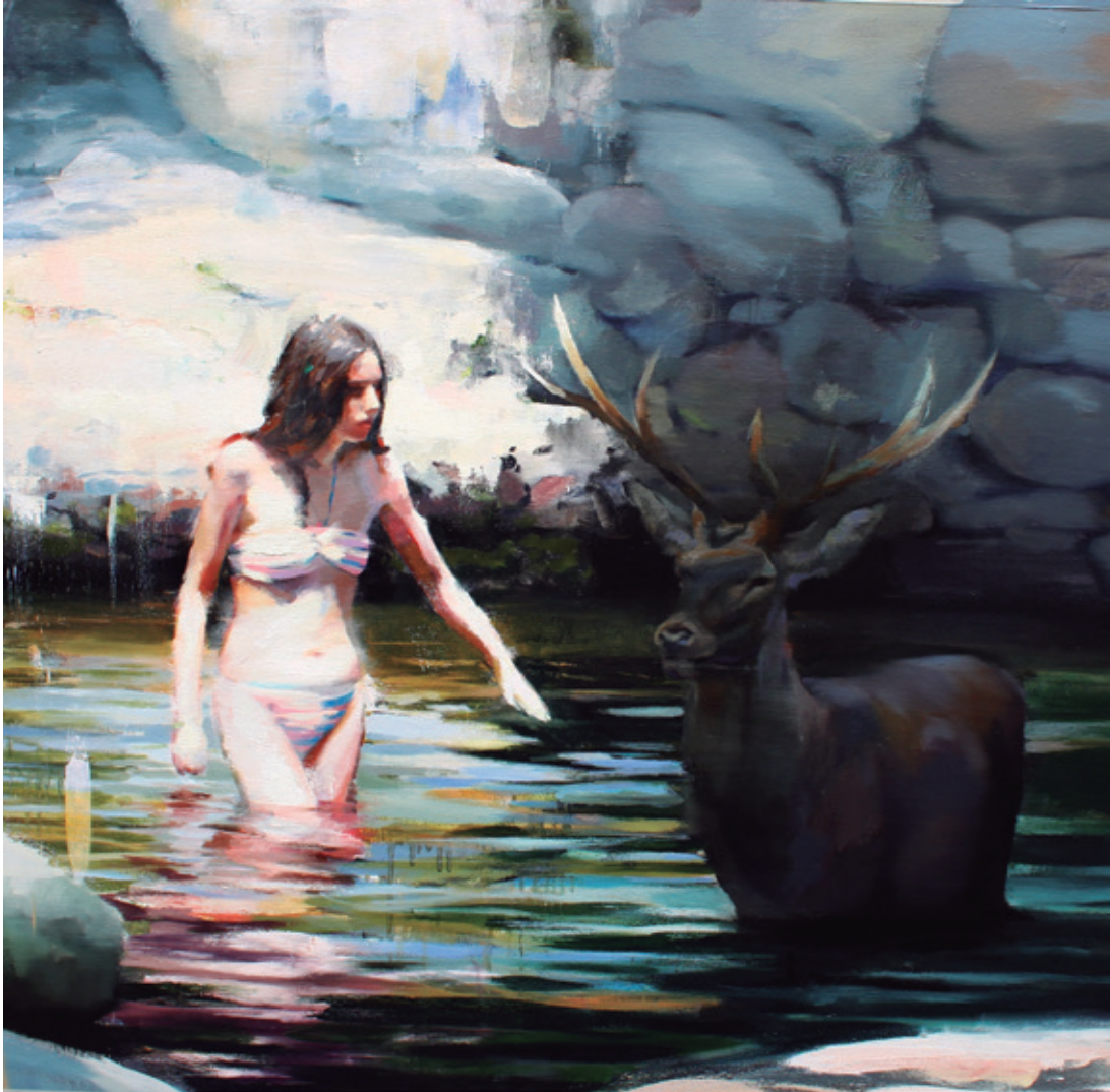
Ciervo de espuma. 2018/2019 Óleo sobre lienzo. 100 x 100 cm