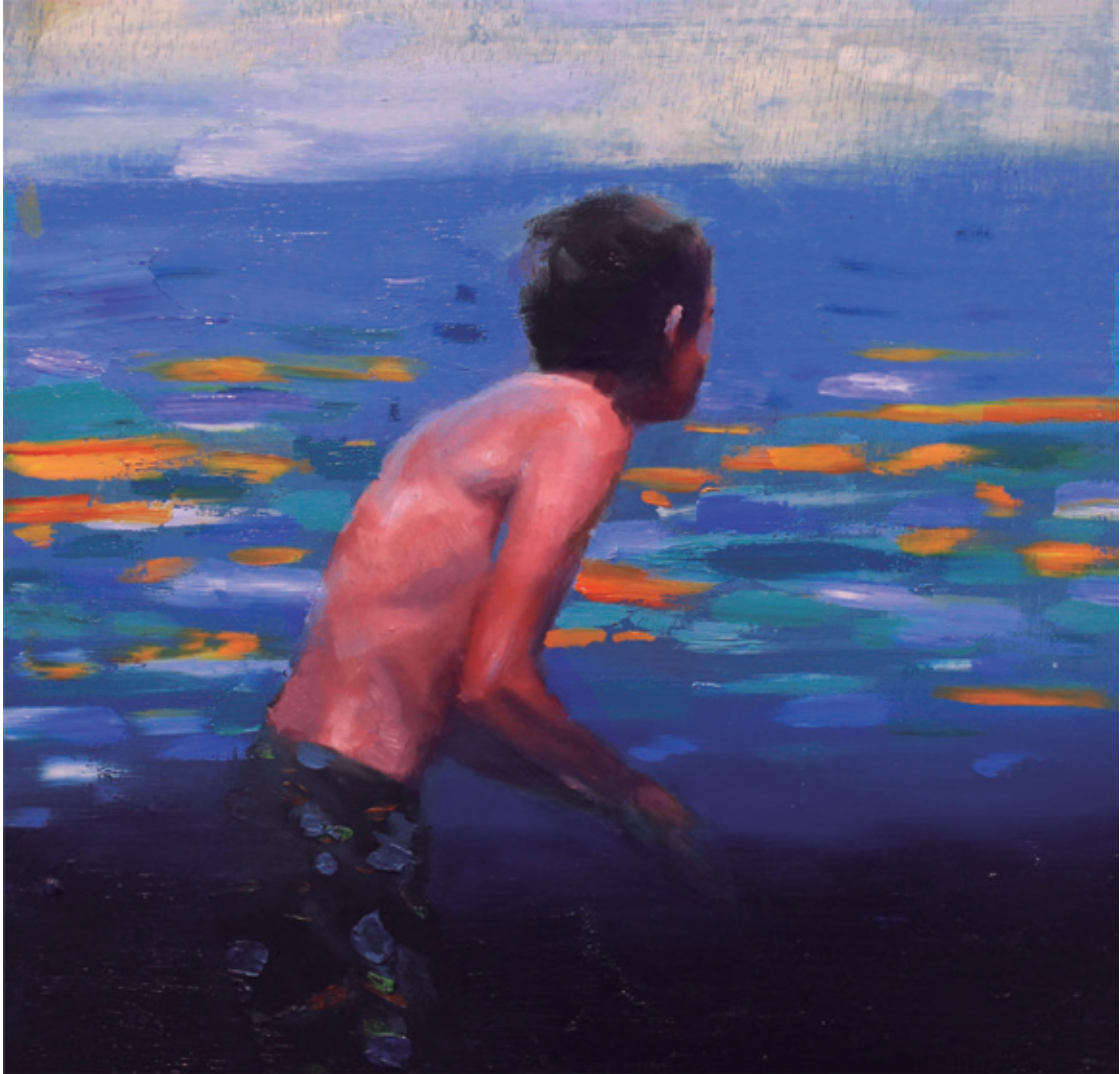
Sin título. 2018/2019 Óleo sobre lienzo. 20 x 20 cm