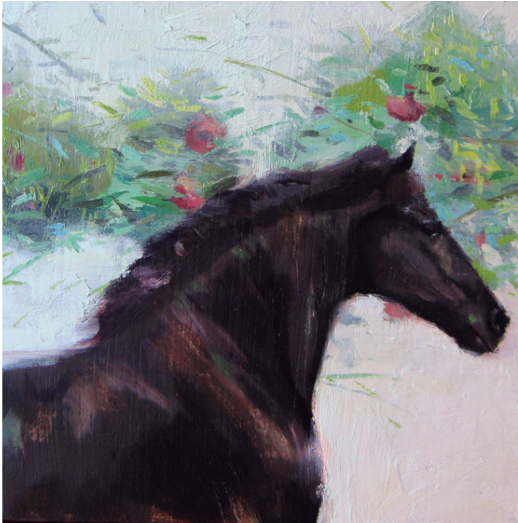
Pasión. 2018/2019 Óleo sobre lienzo. 20 x 20 cm