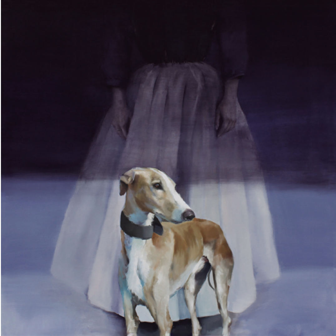
Casada infiel I. 2018/2019 Óleo sobre lienzo. 130 x 130 cm