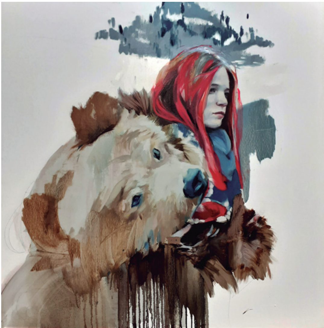
Quisiera ser fiero para ti. II. 2018/2019