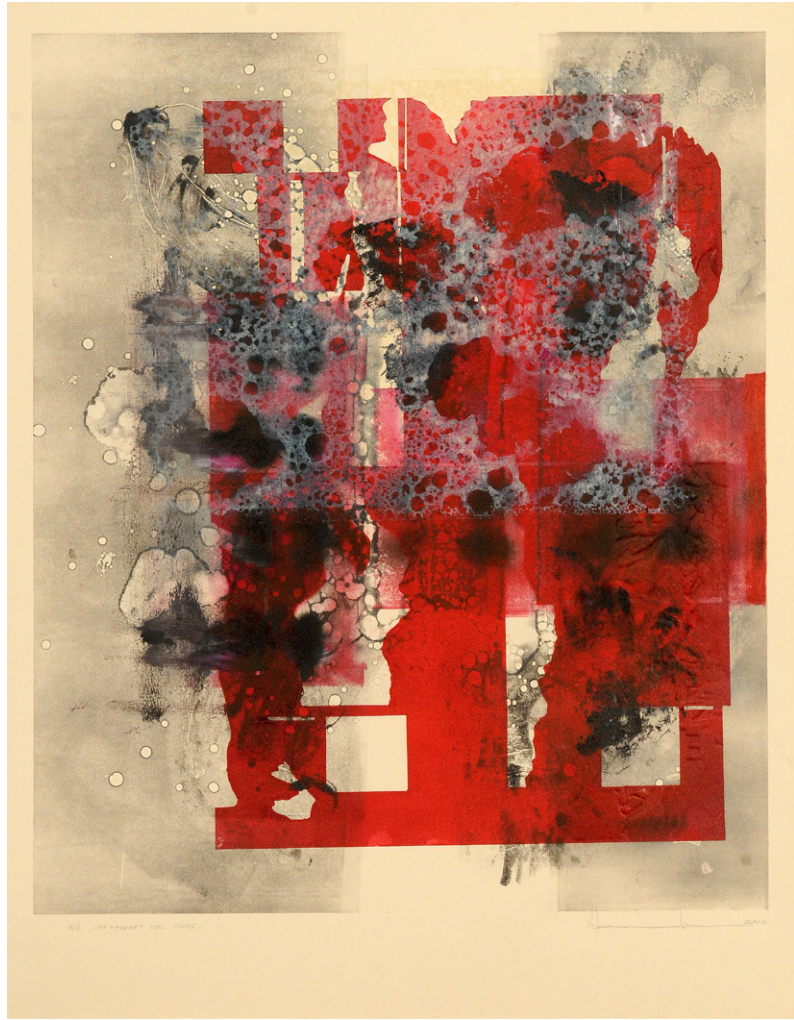
COLORES DEL VIRUS Autor: Florencio de Pedro Grabado. 40 x 60 cm