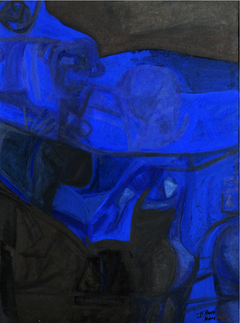
TEMORES AZULES Autora: Teresa Ramón Óleo sobre lienzo. 50 x 80 cm