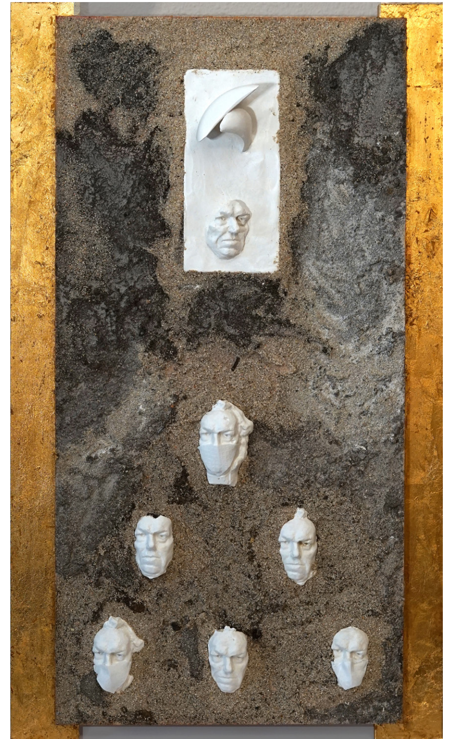
¿QUO VADIS GAIA? Autor: Velásquez-Gómez Temple al huevo sobre tabla. 80 x 50 cm