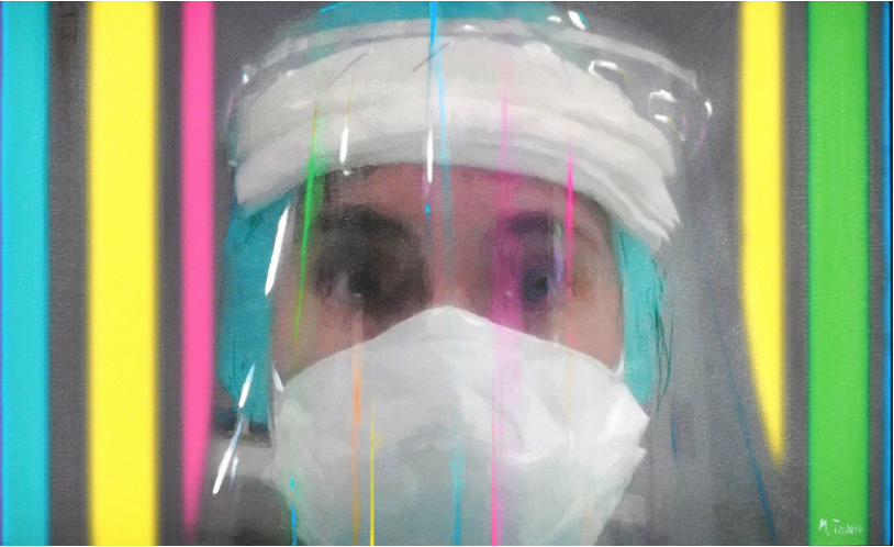
30 DE ABRIL. PRIMER AÑO DEL MIR Autor: Martínez Tintero Óleo sobre lienzo. 80 x 60 cm