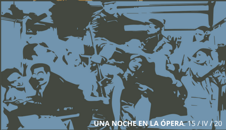
UNA NOCHE EN LA ÓPERA . 15 / IV / 20