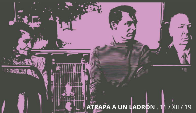
ATRAPA A UN LADRÓN . 11 / XII / 19