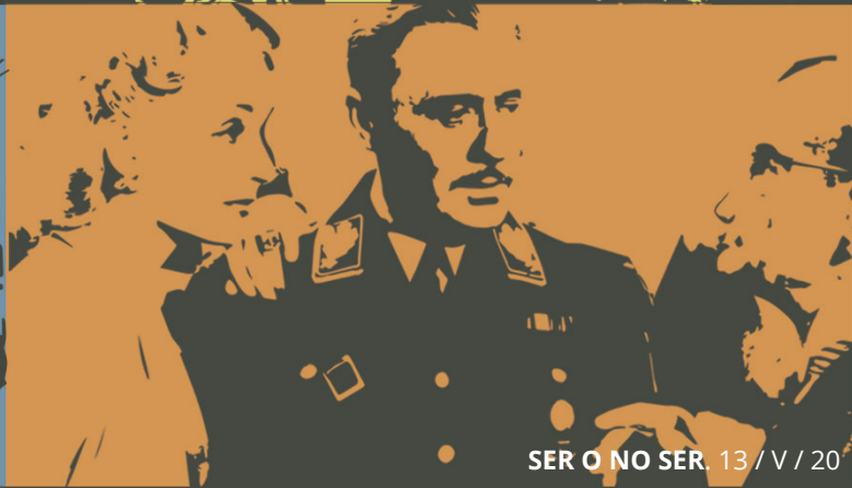
SER O NO SER . 13 / V / 20