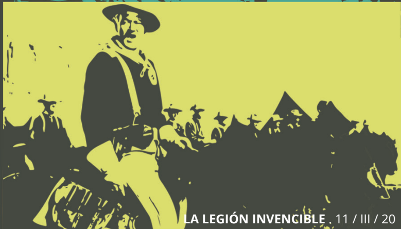
LA LEGIÓN INVENCIBLE . 11 / III / 20