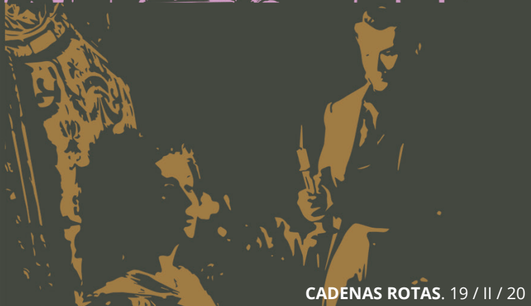
CADENAS ROTAS . 19 / II / 20