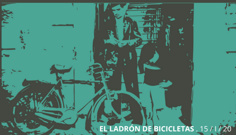
EL LADRÓN DE BICICLETAS . 15 / I / 20