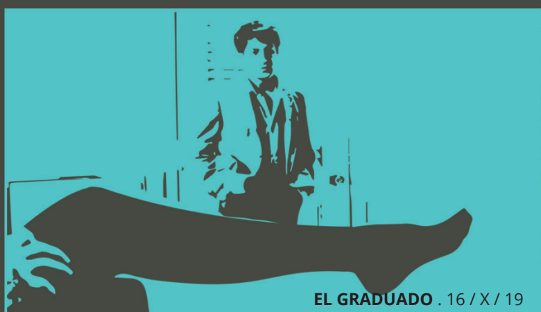
EL GRADUADO . 16 / X / 19