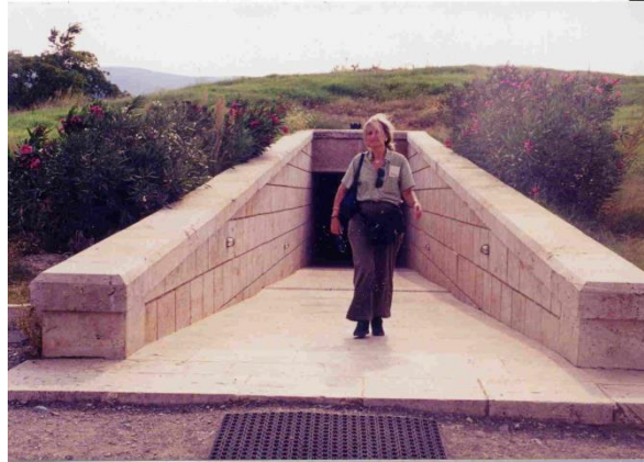
Saliendo de la tumba de Filipo II en Vergina, Macedonia

Ana María Vázquez Hoys, Revista de Arqueología del siglo XXI , año XXVI, nº 289, ( I ) pp.36-45 y ( II ) nº 290, pp.32-39