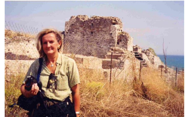
Pidna, Macedonia, lugar donde asesinaron a Olimpia a pedradas