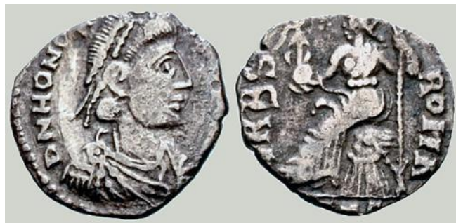
Moneda vándala de época de Genserico (Cartago).

La visión católica de la destrucción vándala es catastrofista. Inminente ya el asedio de la ciudad de Hipona, Posidio de Calama describía de la siguiente forma los efectos de la destrucción bárbara: