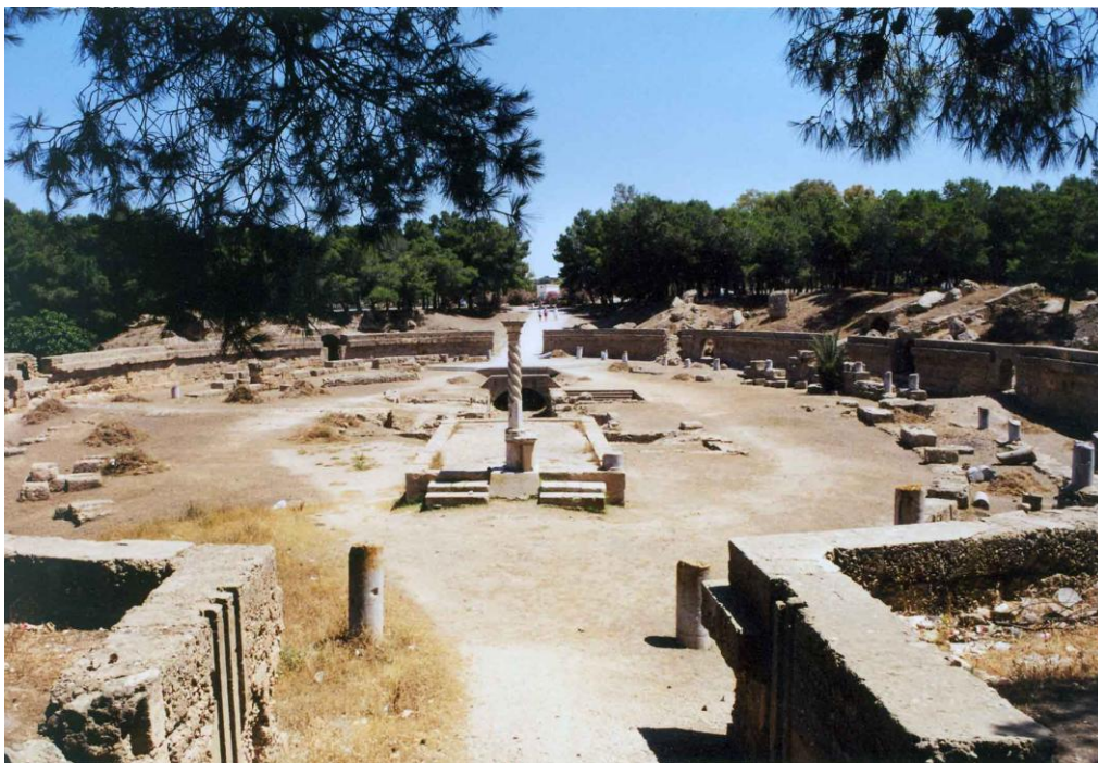
Anfiteatro de Cartago

El 11 de febrero del 435 los vándalos concluyeron un tratado por el que se reconocía su dominio sobre el norte de Numidia, la Byzacena, la Proconsular occidental y casi la totalidad de la Mauritania Sitifiense, a condición del cese de las hostilidades contra los restantes territorios romanos de la diócesis de África. Técnicamente, los vándalos pasaban a ser foederati del Imperio y Genserico un líder foederatus , que, en realidad, se comportaba como un rey sin dicho título. En esta época es posible que Genserico tomara ya medidas drásticas contra el clero católico, que suponía una resistencia al nuevo orden impuesto, ya que se negaba a desocupar iglesias en favor de los “herejes” arrianos y oponía dificultades para la celebración del culto de credo arriano en los territorios ocupados por los vándalos.