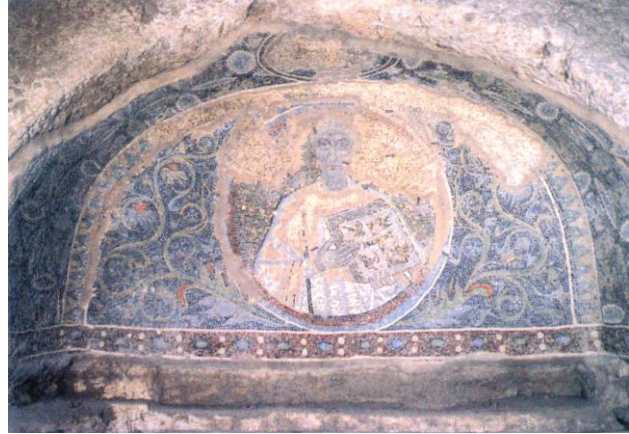
Mosaico de Quodvultdeus, obispo africano exiliado (siglo V). Catacumbas de San Gennaro (Nápoles).

Quodvultdeus, obispo metropolitano de África, afirma en un sermón pronunciado poco después de la toma de Cartago que tanta calamidad hería su vista: