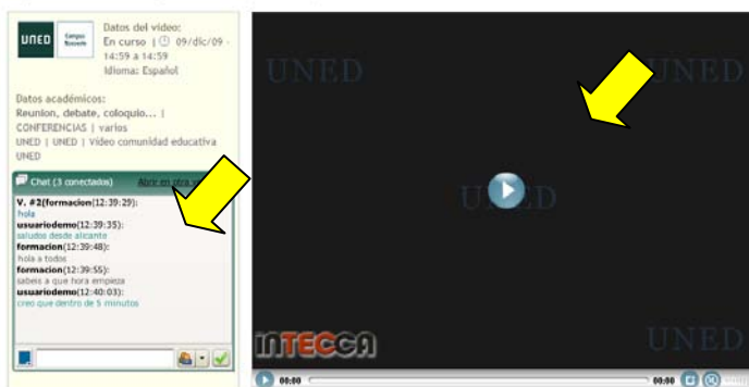
Experiencias EEES Campus Noroeste (en directo)

C/ Educación, 3 15011-A CORUÑA Tfno. 981 14 50 51 Fax: 981 14 59 60 info@a-coruna.uned.es